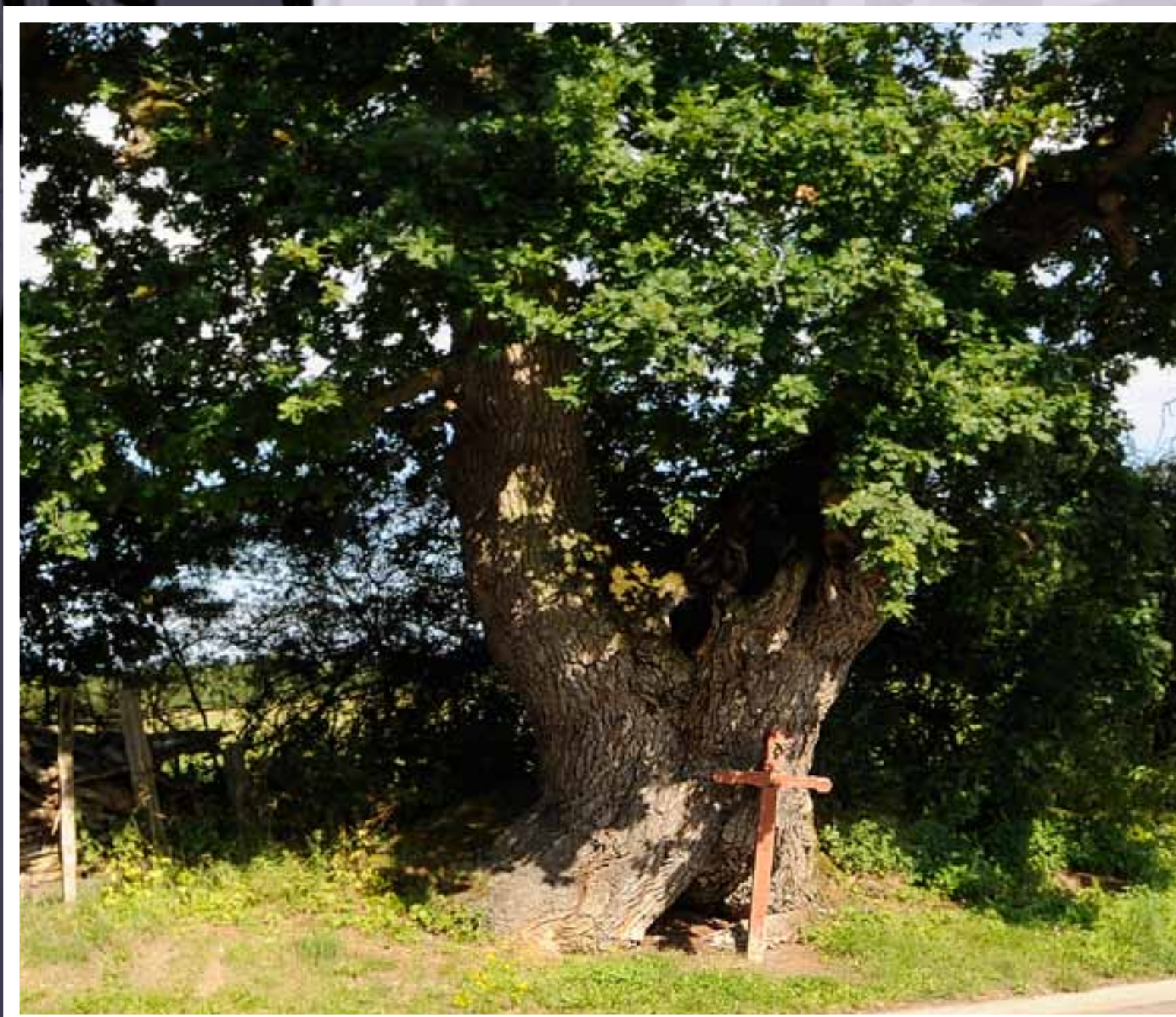
Chêne pédonculé ( Quercus robur ) Circonférence : 557 cm - Hauteur : 20 m