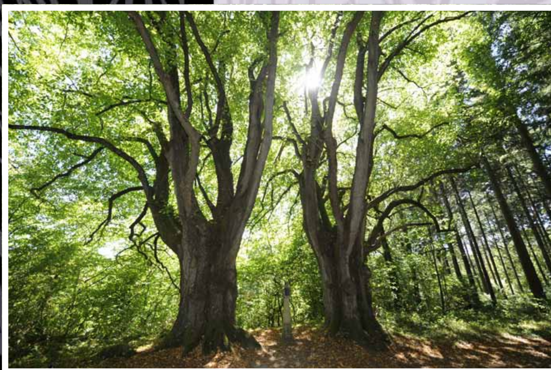
Tilleul à grandes feuilles ( Tilia platyphyllos ) Circonférences : 529 et 535 cm - Hauteur : 34,4 m