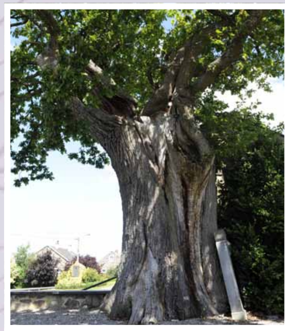
Chêne pédonculé ( Quercus robur ) Circonférence : 452 cm - Hauteur : 14 m

dérés comme les plus grands et les plus vieux du pays. C'est le dernier en Wallonie à être dédié à Saint-Jacques.