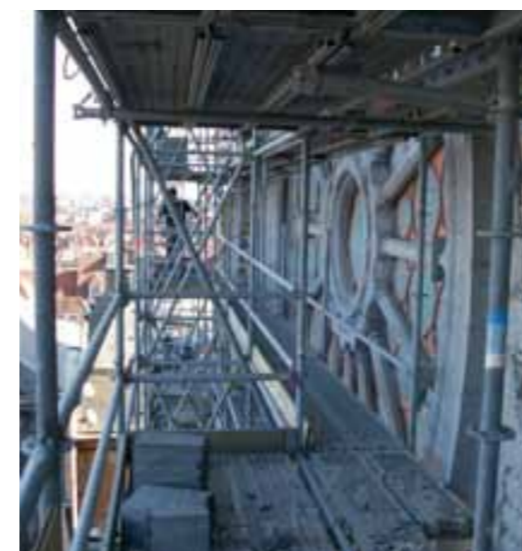
Restauration de la rosace (façade occidentale).

Les murs de la nef ainsi que les éléments moulurés et sculptés sont en pierre de Tournai. Les travaux de restauration ont porté sur le remplacement des pierres dégradées, la réfection des joints au mortier de chaux et la restauration des sculptures des chapiteaux et colonnettes. Les traces d'enduits anciens ont été conservées.