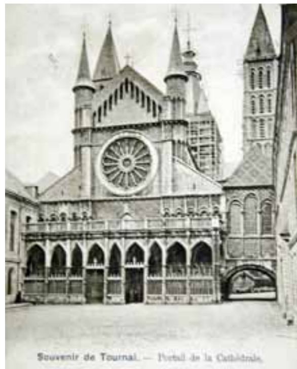
Des témoignages illustrés ont guidé la réalisation du dessin géométrique de la nouvelle toiture de la chapelle Saint-Louis. Cette carte postale date d'env. 1902.

Ce choix a été fait suite à la découverte sur place par l'archéologue du bâti du Département du patrimoine, de tuiles plates de différentes couleurs tirant sur le brun, le rouge, le vert et le jaune.