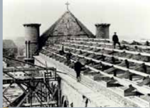
Suite aux bombardements de mai 1940, pose d'une charpente provisoire avant l'installation d'une charpente en béton.

Mai 1940 Bombardements allemands qui incendient la charpente de la nef et la chapelle paroissiale.