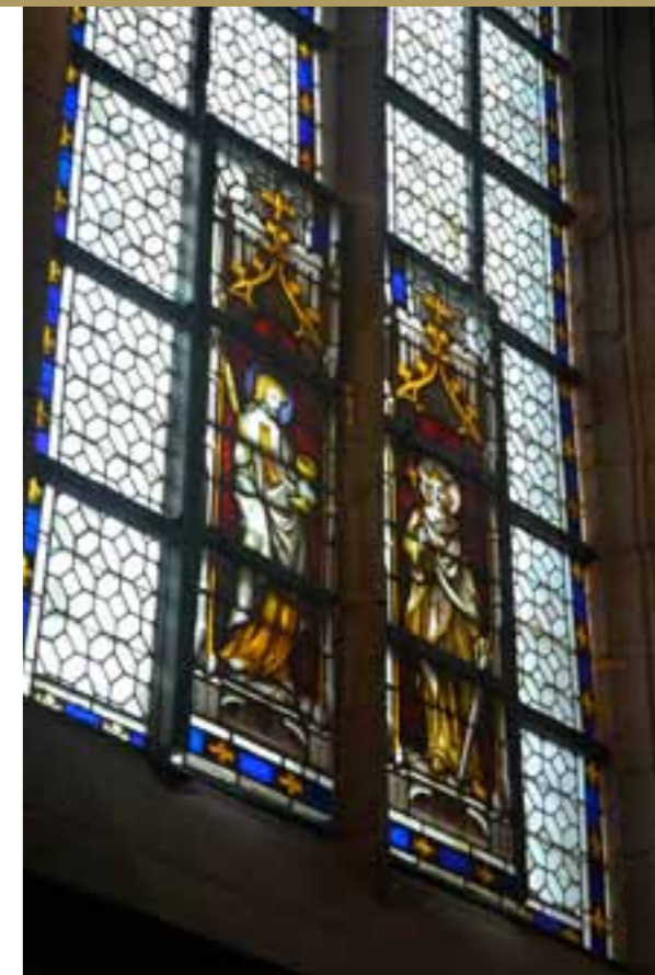
Vitrail de la chapelle Saint-Louis après restauration