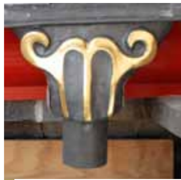
Nouvelles boîtes à eau créées pour la couverture de la nef. Le motif s'inspire de la sculpture des chapiteaux de colonnes de la nef.

La charpente en béton armé de la nef avait été construite après la guerre, suite à l'incendie des charpentes en bois causé par les bombardements allemands en 1940. Elle a été nettoyée. Les chevrons supportant la couverture ont été restaurés ou remplacés, si nécessaire. Des tables de plomb d'1,60 m de long ont alors été mises en œuvre suivant la technique traditionnelle, les « plombiers » refaisant les gestes des anciens.