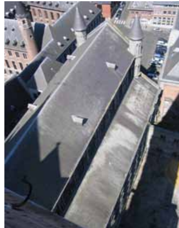
Les toitures d'ardoises de la nef, avant restauration.

L'ensemble des chenaux a été mis à neuf et les lucarnes ont été restaurées. Les éléments en bois ont été recouverts de peinture rouge.